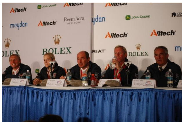
Het Belgische team na de bronzen medaille.