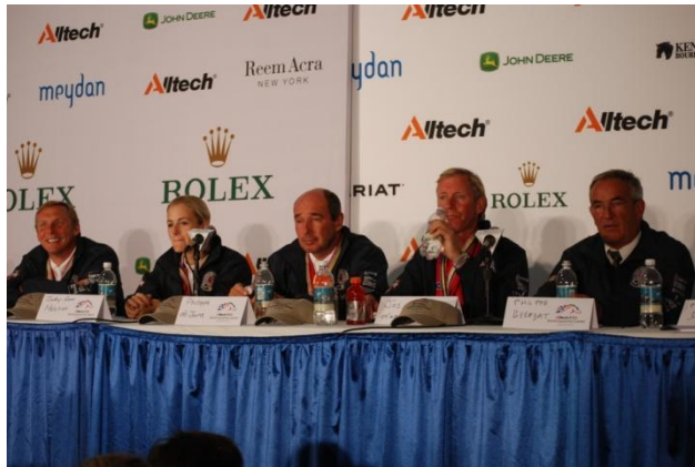
Het Belgische team na de bronzen medaille.

Voor de mooie prestaties van de Belgische jumpingploeg in Kentucky had Philippe Guerdat reeds een andere doelstelling behaald als nieuwe bondscoach in 2010: een promotie naar de "eerste klasse" van de FEI Nations Cup. Na een jaartje in de B-league zal België in 2011 terug met de grote jongens mogen strijden op de prestigieuze wedstrijden!