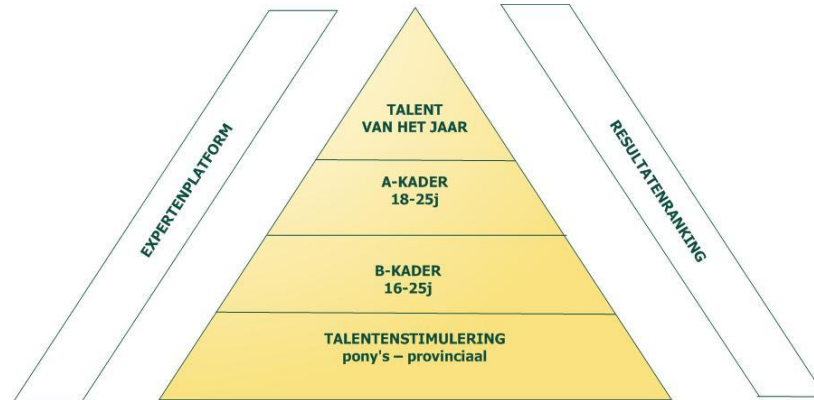
De piramidestructuur van het Talentenplan in 2010.

Het Talentenplan 2010 en Talententeam 2010 werden voorgesteld op 18 januari 2010.