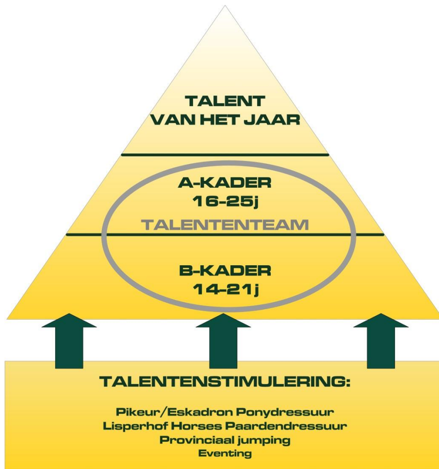
De piramidestructuur van het Talentenplan in 2012.

In het expertenplatform hebben we enerzijds per discipline een groep van sporttechnici, zoals ruiters en trainers. Anderzijds worden deze per discipline aangevuld met de chef d'équipes en coaches van de scholieren, juniors, young riders en seniors. Deze groep van mensen scouten en begeleiden de talenten met het oog op de uitbouw van een sportieve carrière waarbij topsport de einddoelstelling is. Het expertenplatform kwam in 2012 een paar keer samen om in groep te fungeren als denktank rond het ganse VLP-Talentenplan.