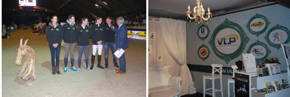
Jumping Mechelen 26/12/2012

Ook het A-kader 2013 werd voorgesteld (samen met hun film) tijdens de VLP-persconferentie én in de A-piste.